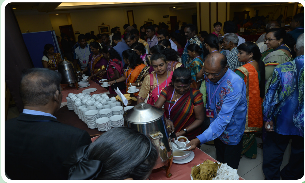
Tea break during Annual General Meeting. ஆண்டுப் பொதுக்கூட்டத்தின் போது தேநீர் விருந்து.