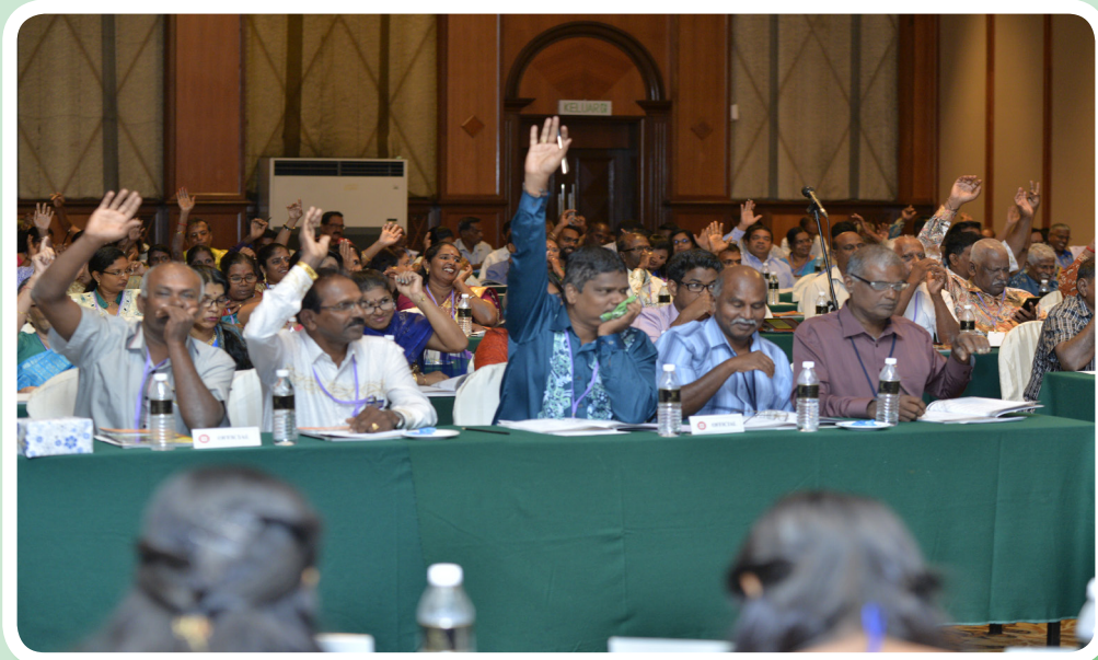
Delegates supporting a resolution. பேராளர்கள் தீர்மானத்தை வழிமொழிகின்றனர்.