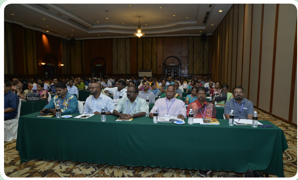
Delegates participating in the Annual General Meeting. ஆண்டுப் பொதுக்கூட்டத்தில் பங்கேடுத்துக்கொண்ட பேராளர்கள்.