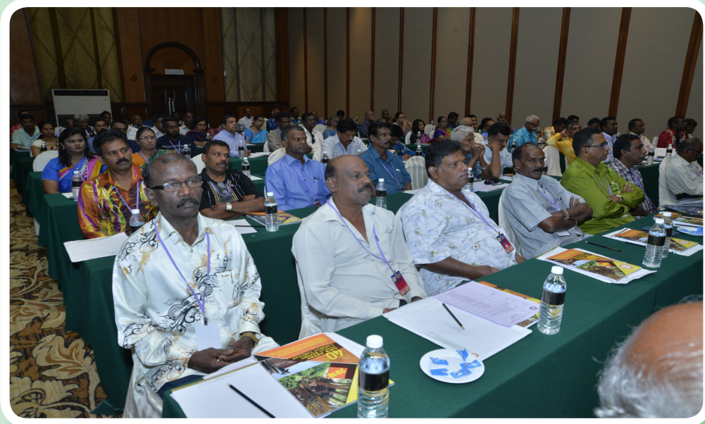
Delegates participating in the Annual General Meeting. ஆண்டுப் பொதுக்கூட்டத்தில் பங்கெடுத்துக்கொண்ட பேராளர்கள்.