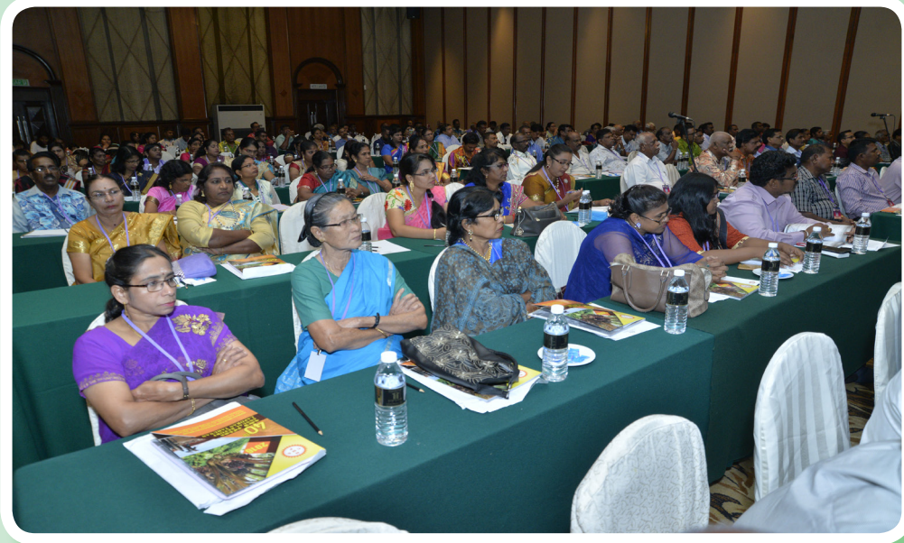
Delegates participating in the Annual General Meeting. ஆண்டுப் பொதுக்கூட்டத்தில் பங்கெடுத்துக்கொண்ட பேராளர்கள்.